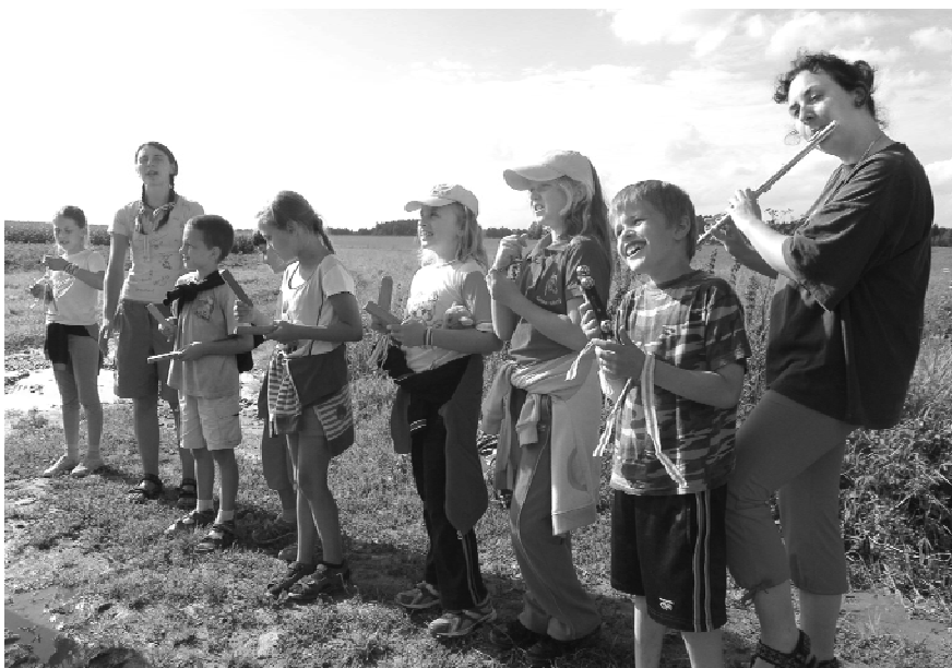
Chaloupka se vyvedla a příští rok nás určitě čeká pokračování.

Během týdne nás každým dnem provázela jedna pohádka. V pondělí jsme po cestě z perníčků navštívili ježibabu, která pak jednoho vedoucího zamkla k sobě chaloupky, v úterý jsme zase museli pomoci najít a vysvobodit písničkami Budulínka a naše plyšová zvířátka od lišky, ve středu jsme s Karkulkou zavítali přes les až do Nové Říše na výlet, čtvrtek jsme strávili s kohoutkem a slepičkou a v pátek jsme dokonce našli poklad.