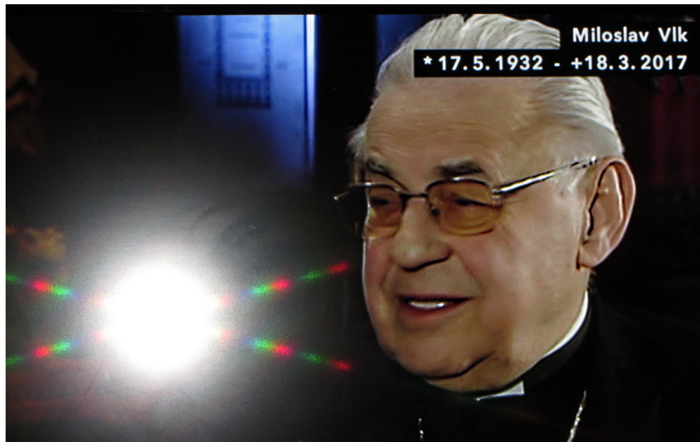
Světlo pro kardinála

Zemřel kardinál Miroslav Vlk, velká osobnost a moudrý člověk. Ať odpočívá v pokoji a v radosti nebe. – Jan Bartošek